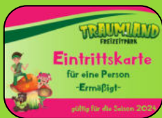
Tickets zu tollen Konditionen für Familie und Freunde