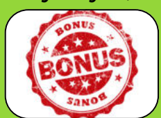
Anwesenheitsprämie (wird zum Vertragsende ausbezahlt)

Nach der Einstellung – Dein Weg zu uns ins Traumland-Team