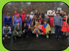
Viele tolle Events (Chefs grillen, Weihnachtsfeier, Ausflüge)