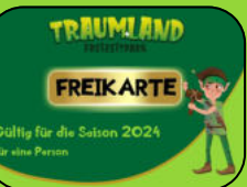
Freikarten für unseren Freizeitpark