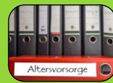
Betriebliche Altersvorsorge 50,- € pro Monat (ab 1 Jahr Betriebszugehörigkeit)