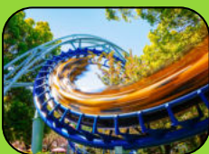
Freier Eintritt in Partner Freizeitparks